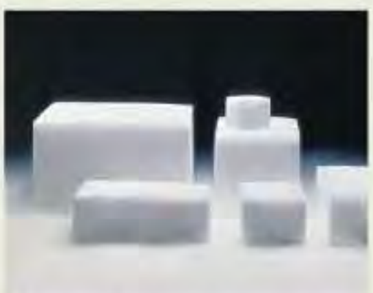
ドライアイス (1日分)