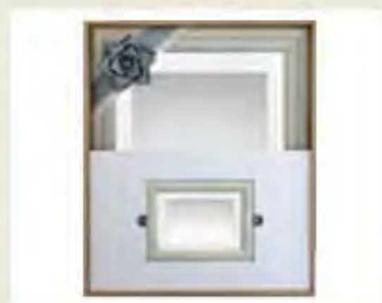
写真 (四つ切・小額付)